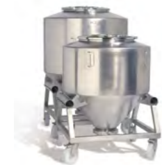
IBC (rund und eckig)